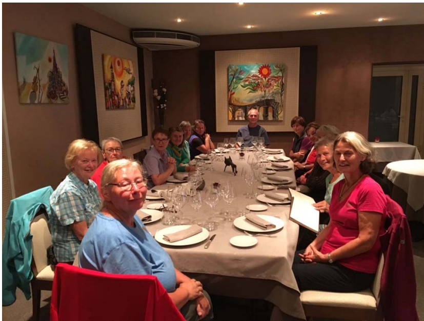
La Cote Saint André Logis Hotel de France zu aller Überraschung gibt es ein Gourmet Menue