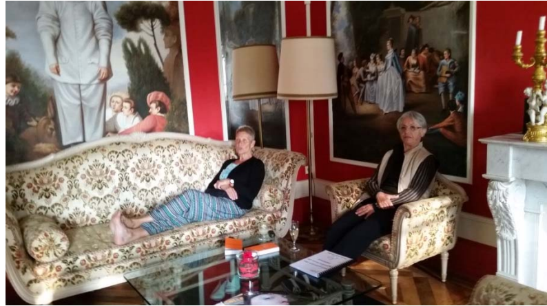
Moissieu sur Dolon