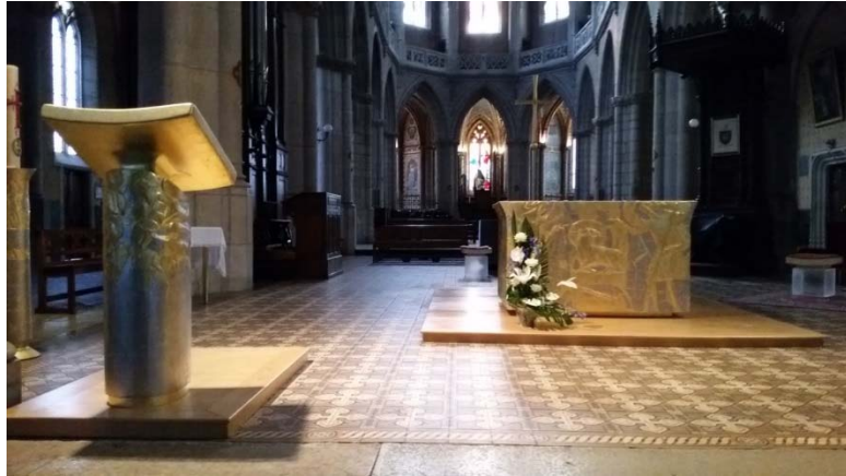
Kathedrale von Belley