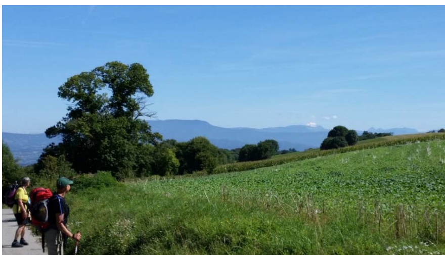
Blick auf den Mont Blanc