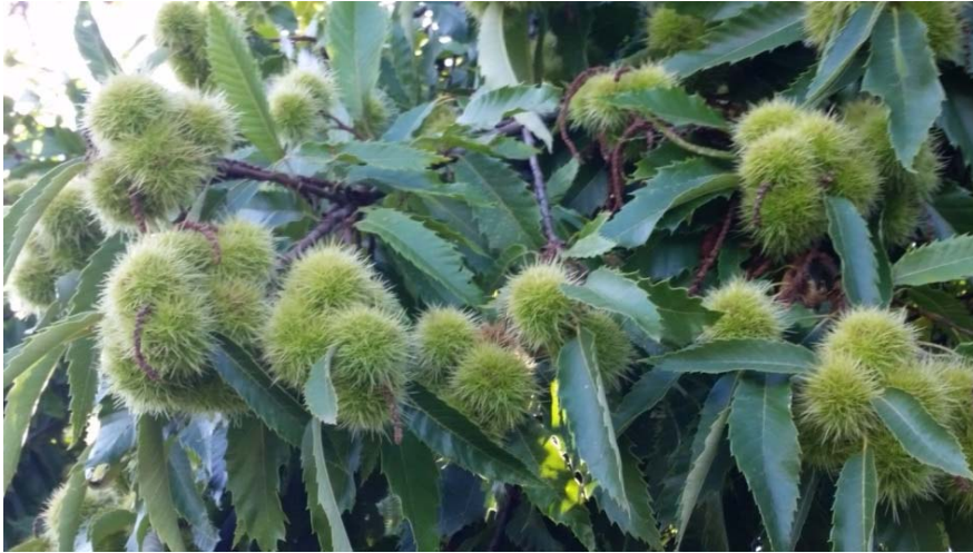
Viele, viele Maronibäume