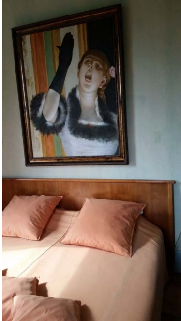
Hotel Domaine de La Colombière