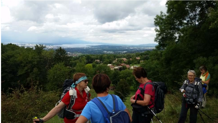
Blick auf den Genfer See