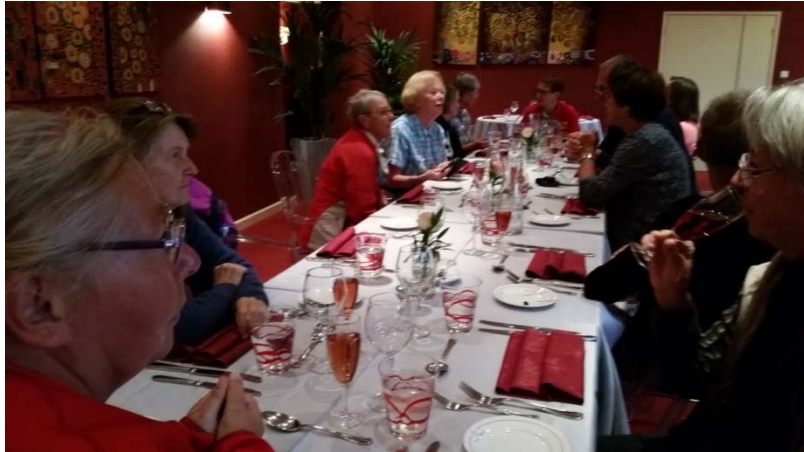
Hotel Domaine de La Columbière Moissieu sur Dolon auch hier ein köstliches, feines Mahl