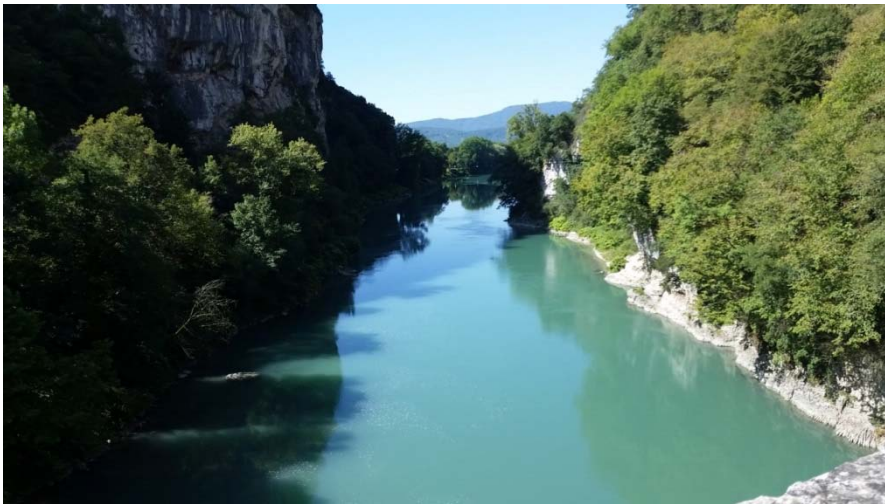
Die Rhone bei Yenne