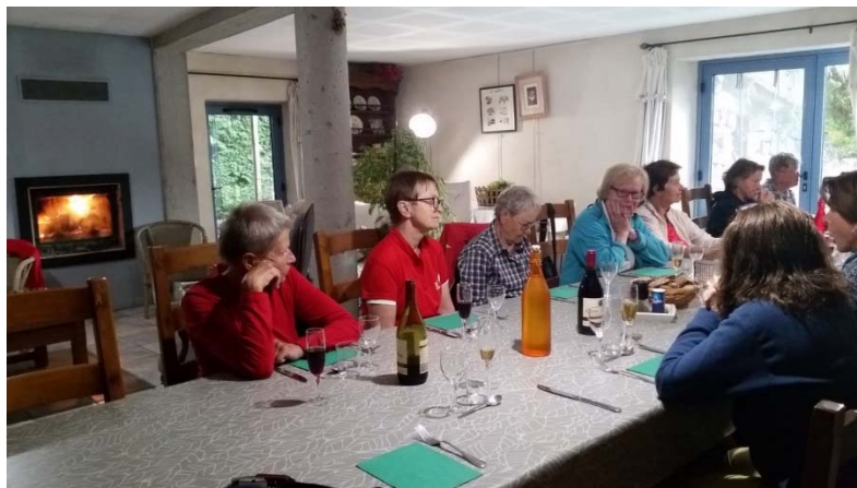
Landaus Le Fougat