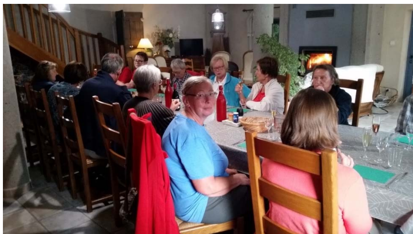
einfach, köstlich, herzlich, idyllisch