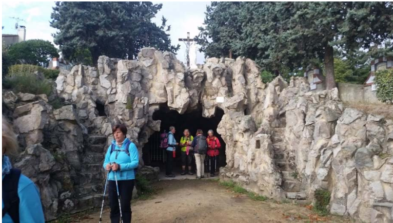
Saint Julian Molin Molette