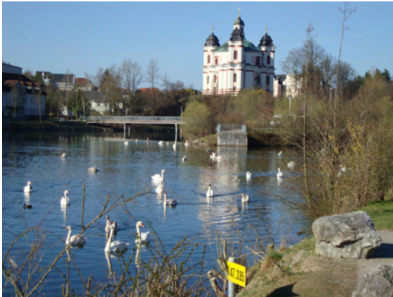
Stadl Paura bei Lambach